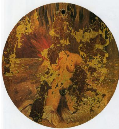
Il cerchio, 1954 circa