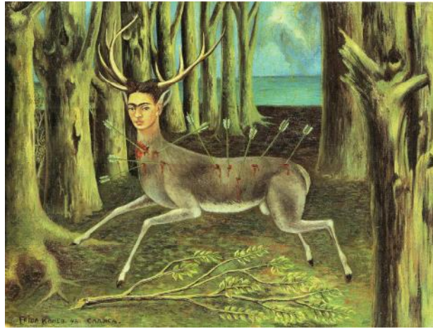
Il cervo ferito o Il piccolo cervo, 1946.