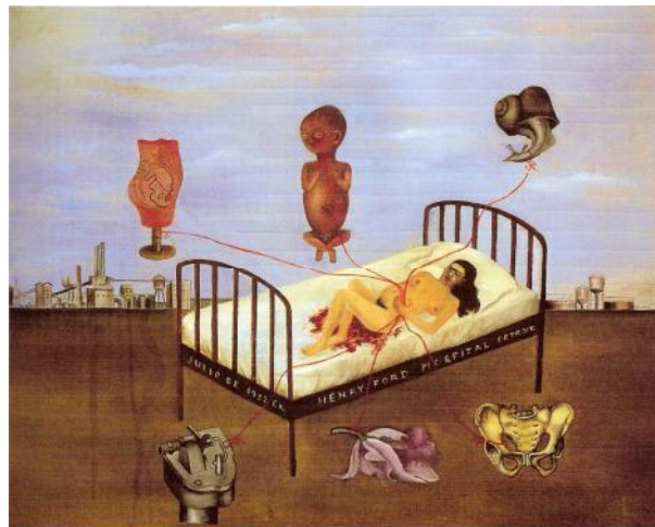
Henry Ford Hospital o Il letto volante, 1932